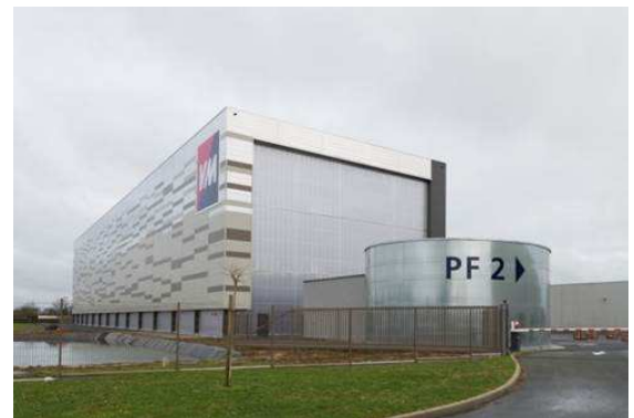
Façade magasin automatisé