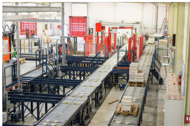
VM Tables de préparation

Dans la continuité de sa stratégie de modernisation et de son objectif d'optimiser les services aux clients, VM a choisi de concentrer l'ensemble de ses moyens logistiques à L'Herbergement (85), à proximité de son siège, en rapatriant l'activité carrelage/sanitaire basée à l'origine à Treillières (44). À cette occasion, l'entreprise se dote d'un magasin automatisé, et met en place un outil industriel et logistique performant. Qualité de service, réactivité et accélération de la logistique sont au cœur de la démarche. Pour y parvenir, un nouveau bâtiment de 20 mètres de haut et de 100 mètres de long a été construit.