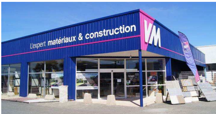
VM Point de vente de Boufféré