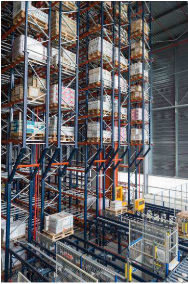
Structure de stockage avec transstockeurs

L'installation est constituée d'élévateurs sur rails circulant dans chaque allée du magasin. Ils sont commandés par le système de gestion, qui pilote la manipulation et l'affectation des emplacements de l'ensemble des produits stockés, à l'aide d'un système d'information de gestion d'entrepôt. Les transstockeurs peuvent déplacer des palettes d'un poids allant jusqu'à 1 500 kg.