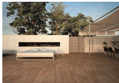
EVO 2 Grès cérame