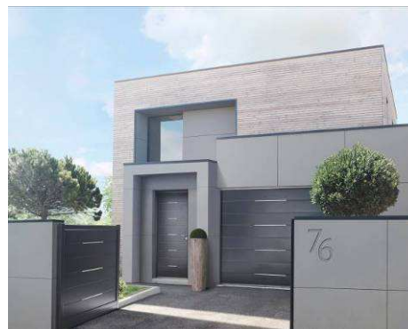
Ensemble coordonné Fabiana de Vendôme

De nouveaux modèles coordonnés en aluminium proposent d'associer porte d'entrée, portail et porte de garage . Cette association contemporaine crée une harmonie d'ensemble et une fluidité visuelle raffinée. Elle personnalise et apporte du cachet aux habitats en accordant l'esthétique d'ensemble des fermetures.