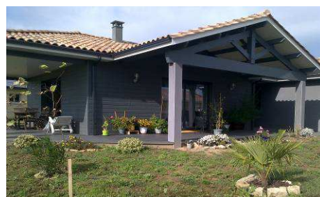
Kaycan Naturetech D5

Nouveaux sur le marché, les bardages constitués à 91 % de fibres de bois (résine à base d'huile minérale et de pigments inorganiques) issues de forêts certifiées PEFC ! Côté couleurs, la tendance 2014 met à l'honneur des teintes «design» allant du gris au noir, tout en proposant les intemporels blanc et beige, qui demeurent des choix incontournables pour une touche classique. Des teintes plus vives viennent compléter l'offre, pour plus de personnalité.