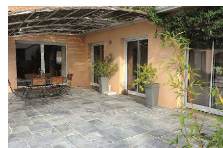
Dallage multi format Palatium

EDYCEM PPL joue la carte de la créativité et du contraste pour apporter une nouvelle dimension aux aménagements extérieurs. Le spécialiste propose de nouvelles teintes allant des plus claires telles que le tuffeau, le saumon, le corail, le ton pierre ou encore la couleur «Atlantic», jusqu'au gris ou carbone. Harmonie colorée assurée !